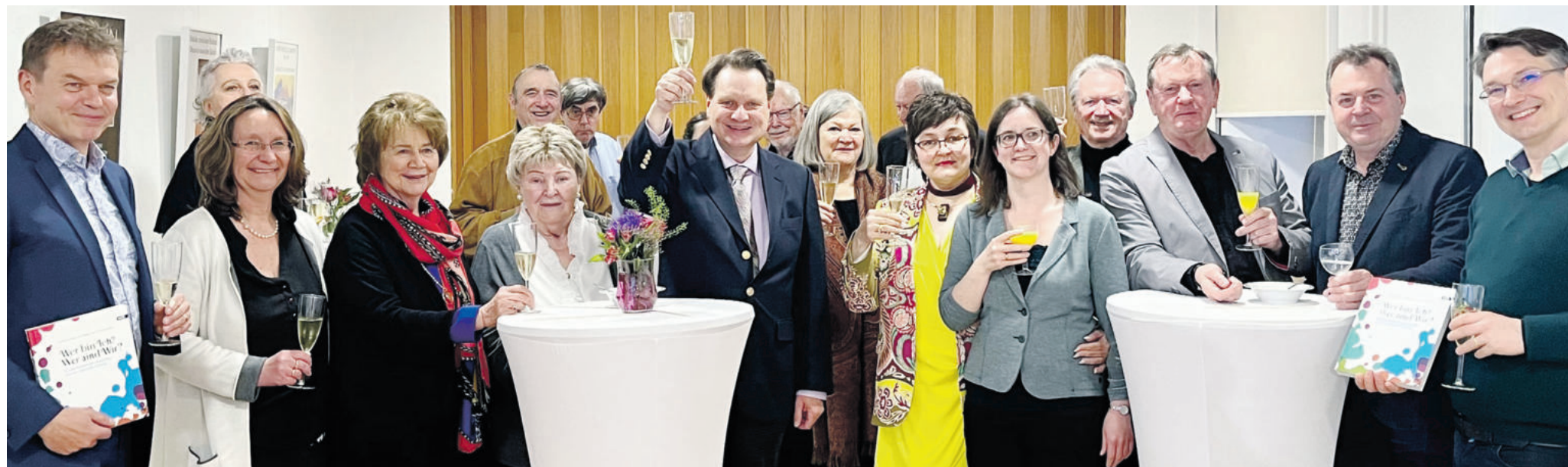
„Buchtaufe“ mit einem Gläschen Sekt im Haus des Deutschen Ostens in München.