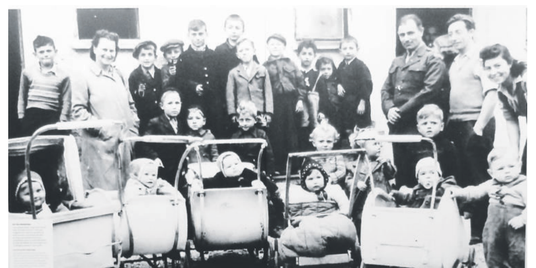
Die Ausstellung zeigt Aufnahmen aus Privatbesitz und aus internationalen Archiven.

Bis Freitag, 29. Juli: „Die Kinder von Föhrenwald und Waldram“ in München-Au, Haus des Deutschen Ostens, Am Lillenberg 5. Montag bis Freitag 10.00–20.00 Uhr. Informationen www.hdo.bayern.de , erinnerungsort-badehaus.de