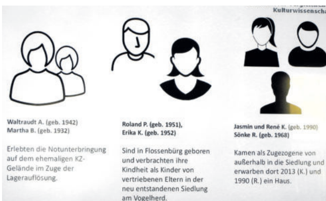
Interviewpartner aus drei Generationen.

Tatsächlich haben auch die Straßen dort passende Namen wie Sudetenstraße, Schlesierweg oder Egerlandstraße. Immer noch lebten viele Mitglieder der ersten Generation der Erbauer und deren Kinder dort. Zusätzlich kämen die Enkelgeneration und später Zugezogene dazu. Die von ihr Befragten hätten sich sehr verschieden über den Umgang mit der Lager-Vergangenheit geäußert, so Möl-