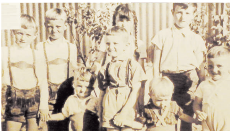
In der Ausstellung: Bilder und Dokumente zur Kindheit im Lager.

Im Lauf von zwölf Jahren lebten, weitgehend abgeschirmt von der Außenwelt, tausende Menschen in dieser Enklave jüdischen Lebens. Im Februar 1957 mußten die letzten DPs das Lager verlassen. Sie wurden vor allem in München, Frankfurt am Main, Düsseldorf und Köln untergebracht.