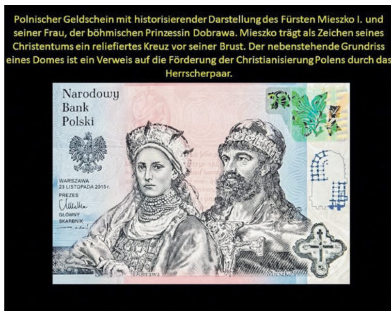
Geldschein mit Fürst Mesko und seiner Frau Dobrawa.

Nun seien auch die Ungarn missioniert worden. Daher stamme auch die Bezeichnung „Stephanskron“, da sich ihr erster König Waik von Bischof Adalbert von Prag auf den Namen Stephan, ungarisch István, habe taufen lassen. Damit sei der Weg