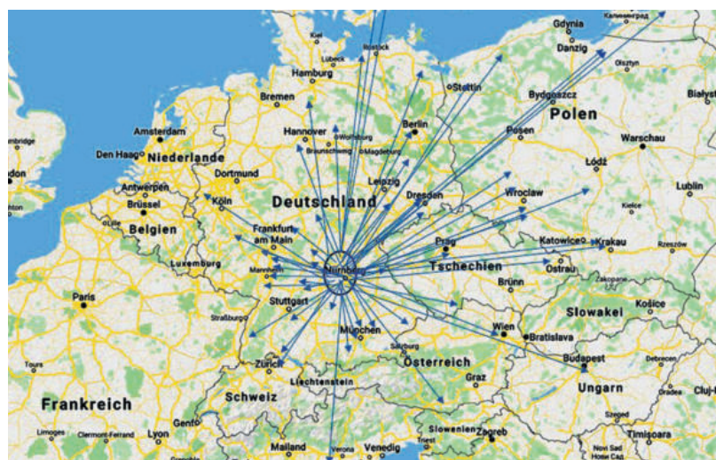
Familiennetzwerk der Hohenzollern bis ins 16. Jahrhundert.

Auch die Bayern hätten weitere östliche Heiratsnetzwerke geschaffen, wie Herzog Heinrich XIII. von Bayern und der Pfalz mit Prinzessin Elisabeth von Ungarn. Sein ältester Sohn, Otto III. von Bayern, habe als Sohn dieser ehemaligen ungarischen Prinzessin die Stephanskron angeboten bekommen und bei der Krönung in Budapest einen neuen ungarischen Namen angenommen. „Er wählte dafür den Namen seines Großvaters mütterlicherseits, König Bela IV.