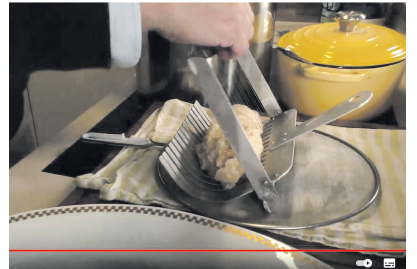
Der original böhmische Knödelschneider kommt zum Einsatz.