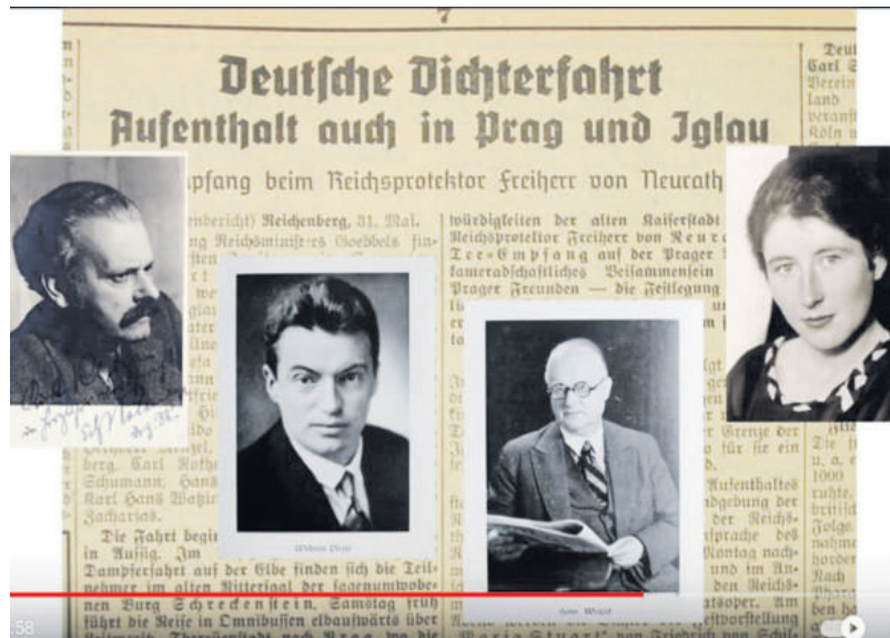
Die Erste großdeutsche Dichterfahrt ist eine politische Maßnahme.

der Trennung war so stark, daß sie selbst nach Ende des Zweiten Weltkriegs wirksam blieb, wenn auch auf den Kopf gestellt, wodurch der Gegensatz von Prager und sudetendeutscher Literatur