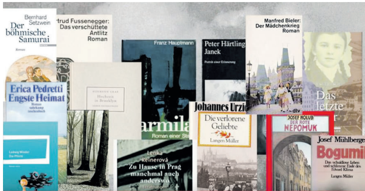
Literatur, die ganze Epochen in den böhmischen Ländern spiegelt.

Das literarische Leben im Sudetengau und im Protektorat sei mit der Etablierung der NS-Herrschaft allerdings nicht zum Erliegen gekommen. „Vielmehr fand eine intensive Förderung statt, die manchen Leser vergessen machen konnte, wer und was alles fehlte.“ Es habe Dichterlesungen, Buchausstellungen, Gaukulturwochen, Dichtertreffen, Preisverleihungen und bereits im Sommer 1939 eine Erste Großdeutsche Dichterfahrt gegeben. „Nun erfolgte die endgültige Ausklammerung mißliebiger Autoren“, und es habe eine scharfe Trennung zwischen arischen und jüdischen, zwischen demokratischen und nationalsozialistischen Autoren gegeben. „Das wirksamste Mittel dafür waren die Förder- und Verbotslisten der nationalsozialistischen Kulturpolitik.“