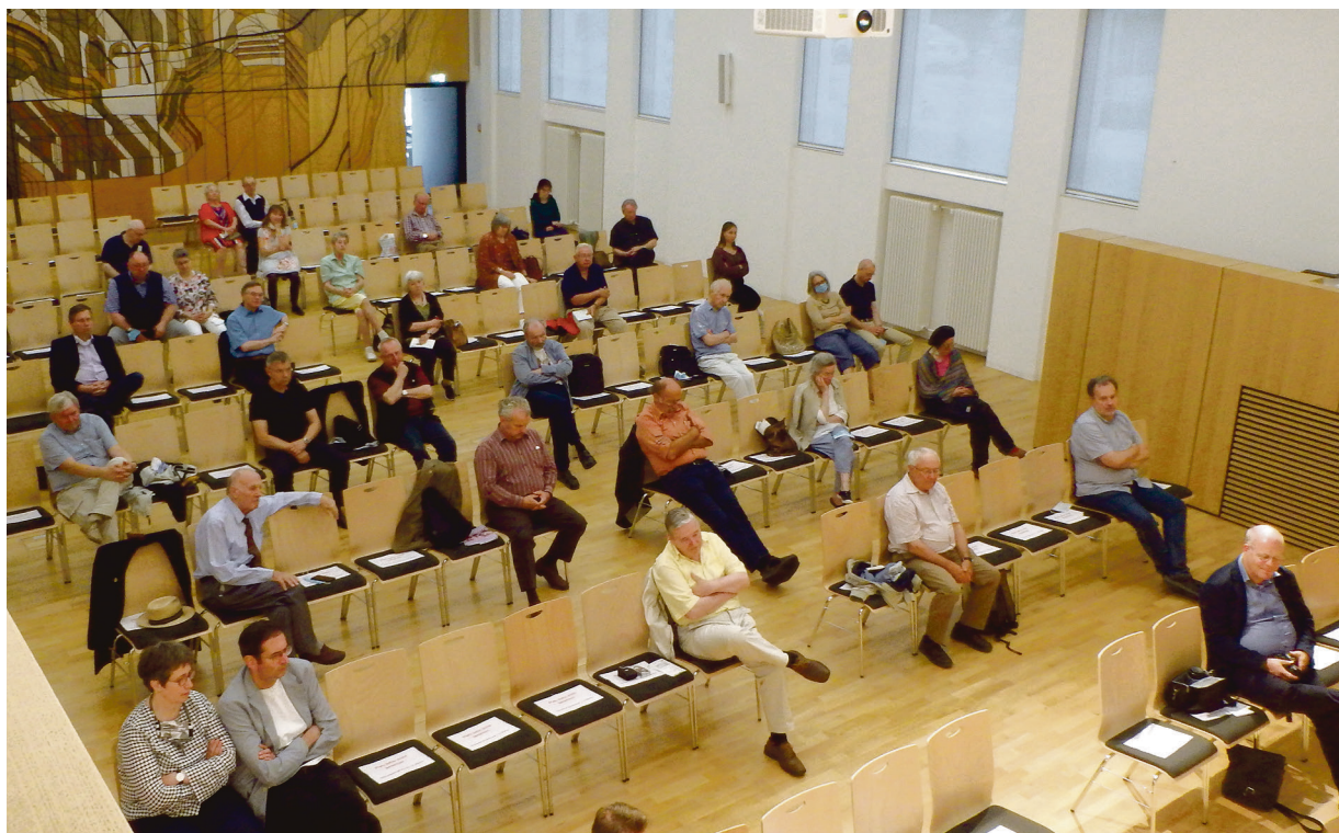
Die wegen der Hygienestandards reduzierten Sitzplätze im Adalbert-Stifter-Saal waren rasch gefüllt.