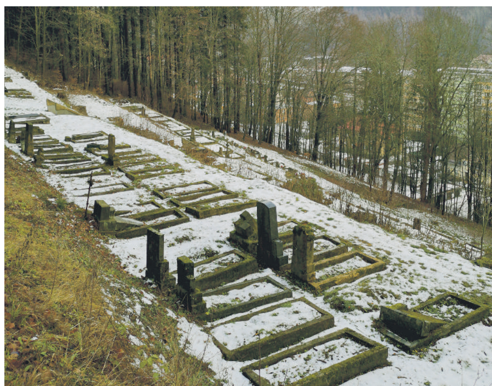
Der Friedhof von Marschendorf I/Kreis Trautenau, Detail von einem alten deutschen Grab und der Friedhof von Jungbuch/Kreis Trautenau.