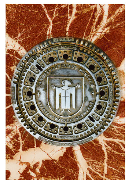
„Kanalabdeckung 1“ (2009).