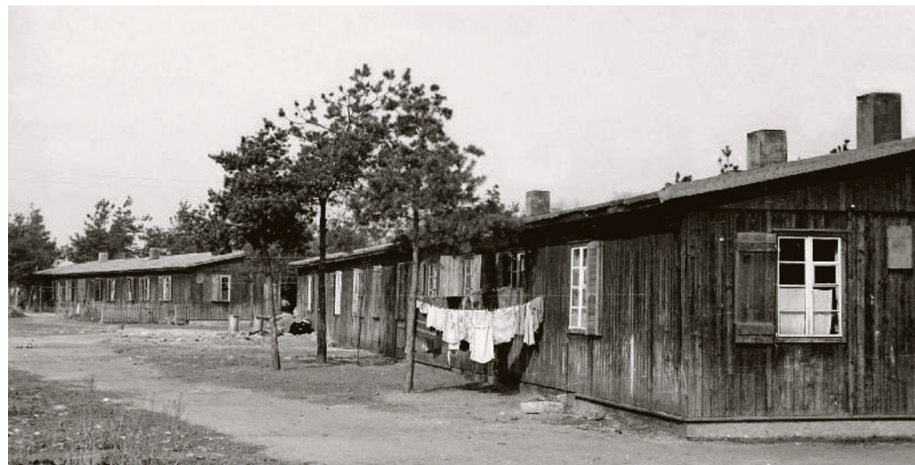
Ansiedlung von deutschen Heimatvertriebenen nach Ende des Zweiten Weltkrieges in Erlangen: Links Baracken im Flüchtlingslager Nürnberger Straße 145. In der Mitte neuerbaute GeWoBau-Siedlungen an der Brüxer Straße sowie der Siemensche Himbeerpalast; im Hintergrund die Erlanger Altstadt. Rechts der Katalog „Die brennendste aller sozialen Fragen“, München 2020, 82 Seiten, 3 Euro (ISBN 978-3-938831-95-3), erhältlich im Buchhandel oder per eMail bei poststelle@bayhsta.bayern.de

Bis Montag, 7. September: „Die brennendste aller sozialen Fragen. Kommunale Wohnungspolitik zwischen 1918 und 1954 in München, Nürnberg, Erlangen“ in München-Maxvorstadt, Bayerisches Hauptstaatsarchiv, Schönfeldstraße 5. Montag bis Donnerstag 8.30–16.00, Freitag 8.30–13.00 Uhr. Eintritt frei; Pflicht zum Tragen von Mund-Nasen-Schutz.