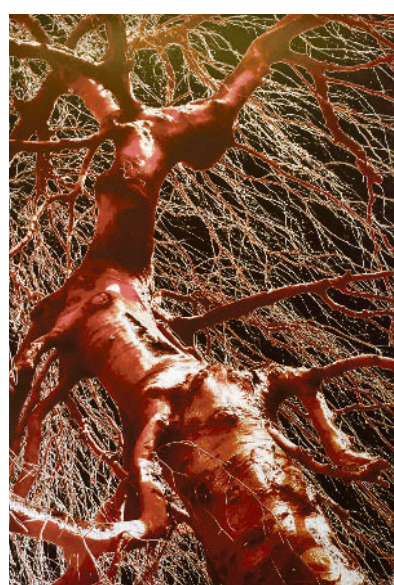
„Bäume 8“ (2007).

Bis Mittwoch, 29. Juli: „Städte... Unter den Füßen... Über dem Kopf...“ in München-Au, Haus des Deutschen Ostens, Am Lilienberg 5. Montag bis Freitag 10.00–18.30, ab 1. Juli 10.00–20.00 Uhr. Nur nach Anmeldung unter Telefon (089)449993101 oder eMail poststelle@hdo.bayern.de.