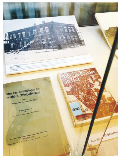
Blick auf einige Exponate.

Die Sonderausstellung behandelt diese Zeit vor und nach der Gründung der Wolgadeutschen Republik, die am 6. Januar 1924 von ihrem XI. Rätekongress als „Autonome Sozialistische Sowjetrepublik der Wolgadeutschen“ (ASSRdWD) ausgerufen wurde. Sie bestand bis nach dem Beginn des Deutsch-Sowjetischen Krieges am 22. Juni 1941 und zur Auflösung im August 1941, als die Wolgadeutschen wie die anderen Rußlanddeutschen in den Ural sowie nach Si-