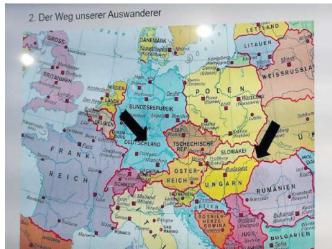
Der Weg der Auswanderer führt von Franken über Österreich nach Oberungarn.