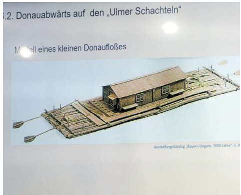
Die Auswanderung: Aus fränkischen Dörfern ging es an die Donau und mit Ulmer Schachteln über Wien bis fast nach Mukatsch.