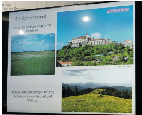
Nach der Ankunft in Mukatsch werden weitere Orte gegründet, von denen Distler besonders das Straßendorf Pausching vorstellt.