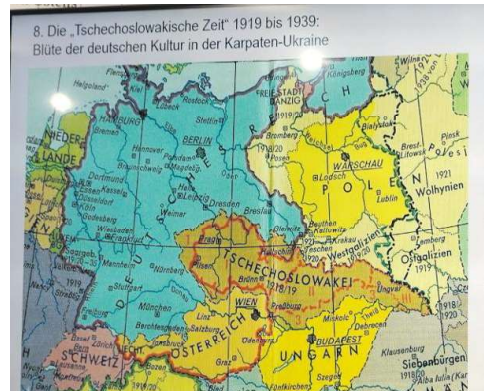
In der Zeit in der ČSR von 1919 bis 1939 lebt das deutsche Kulturleben auf, das unter den magyarisierenden Ungarn gelitten hat.