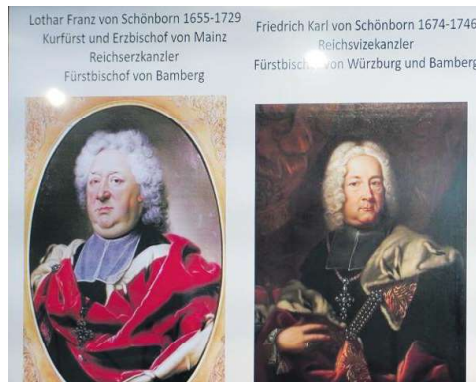
Die Initiatoren aus dem fränkischen Zweig der von Schönborns.