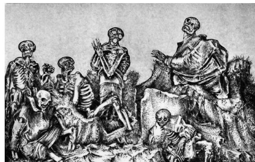
Peter Grau: „Das Gericht (Apokalypse)“ (1964).

Die letzte Wand, überschrieben mit „Letzte Dinge“, vereint Darstellungen zur biblischen Apokalypse sowie zur mythologischen Gestalt des Totenfährmanns Charon. Die umfangreiche Serie über die Offenbarung des Johannes schuf Grau zu Beginn seiner Tätigkeit als Radierer bis Mitte der 1960er Jahre. Er veranschaulichte beliebte Themen der Kunstgeschichte wie die „Reiter“ oder „Das sechste Siegel“.