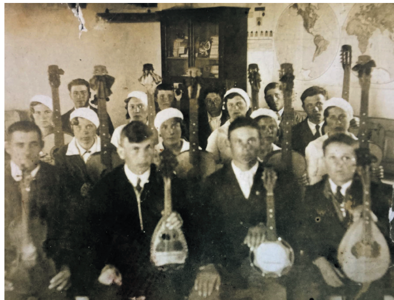
Das Jugendorchester von Scharowo in den dreißiger Jahren des 20. Jahrhunderts.