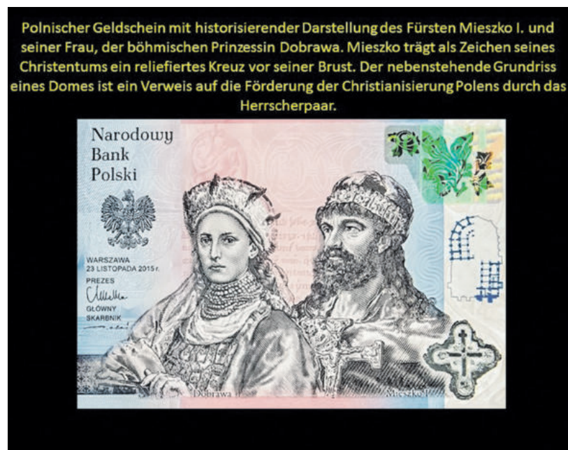
Geldschein mit Fürst Mesko und seiner Frau Dobrawa.

Nun seien auch die Ungarn missioniert worden. Daher stamme auch die Bezeichnung „Stephanskron“, da sich ihr erster König Waik von Bischof Adalbert von Prag auf den Namen Stephan, ungarisch István, habe taufen lassen. Damit sei der Weg