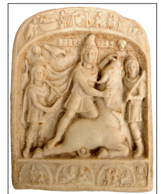
Votivtafel aus Marmor aus dem 2. Jahrhundert n. Chr.

In Toulouse wird sie vom 13. Mai bis zum 30. Oktober d. J. und in Frankfurt am Main vom 19. November 2022 bis zum 15. April 2023. B. U.