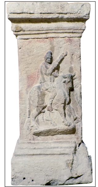
Standbildsockel aus Sandstein aus dem 2. Jahrhundert n. Chr.

Als Triptychon inszeniert (unser Bild) werden die Dinge zu Kategorien: Das Fleisch, der Leib, Träger der Konkretion, der realen Welt - im Gegensatz zu der zarten Mohnblume, Inbegriff der Vergänglichkeit, im Augenblick wunderschön, entgegen der Seherfahrung ohne Gefäß - und der Melanchthon-Brief, die aufs Äußerste konzentrierte Botschaft steht für Humanismus und Aufklärung, als Träger unvollkommenen Wissens, durch die Reflexion als Täuschung weitergeführt. Leib, Geist, Natur, ihrerseits gespiegelt, werden in mehrfachem Sinn zum Objekt der Reflexion. Heidrun KÖNIG