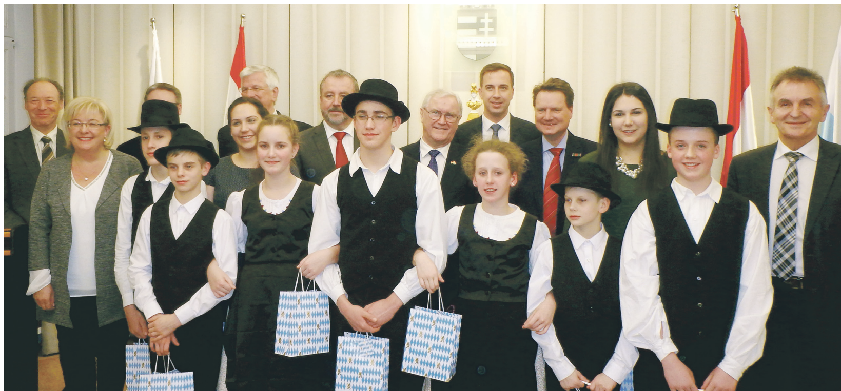
Am Schluß freuen sich alle Mitwirkenden über die schöne Gedenkveranstaltung in München.